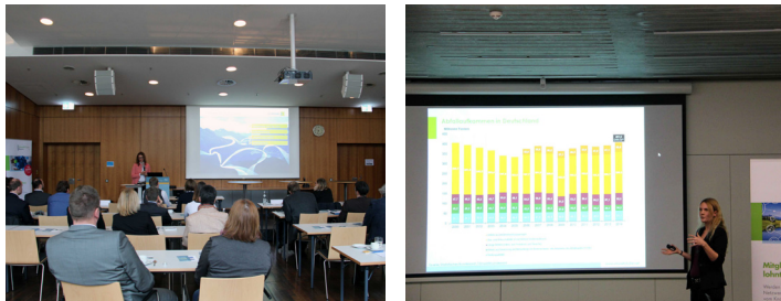
Linkes Bild: Das Unternehmerfrühstück „Mehr Ressourceneffizienz durch Digitalisierung“ gab rund 30 Teilnehmern die Möglichkeit zu interessanten Diskussionen.

Was verbirgt sich hinter diesem Begriff? Warum muss man effizient mit Ressourcen umzugehen? Diese und weitere Fragen beantwortete die modular aufgebaute Ausstellung unter dem Motto „Weniger ist mehr“. Anhand von Beispielen wurde gezeigt, wie bayerische Unternehmen neue Maßstäbe in der Ressourceneffizienz setzen. Interaktive Module wie ein Effizienz-Check und Informationsfilme ergänzten die Ausstellung.