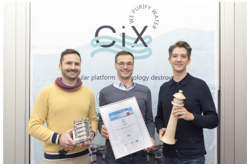
Abbildung 3: Die Gewinner des Leuchtturms 2025 CiX GmbH.

Die Reinigungssysteme von CiX basieren auf einer neuartigen elektrochemischen Plattformtechnologie. Die Reinigungssysteme arbeiten ausschließlich mit elektrischem Strom - vollständig ohne den Einsatz zusätzlicher Chemikalien, Filtermaterialien oder externer Entsorgungsketten. Kern der Technologie sind neu entwickelte Diamantelektroden, die gezielt hochreaktive Prozesse im Wasser auslösen und selbst besonders stabile organische Verbindungen zuverlässig zerstören.