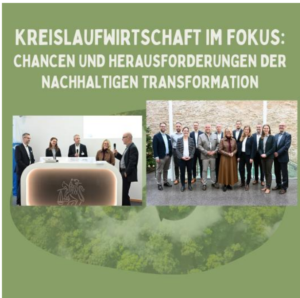
Abbildung 10: Impressionen vom BIHK-Event in Regensburg.

Am 30. November 2025 veranstalteten der Umweltcluster Bayern und die IHK Regensburg eine gut besuchte Veranstaltung zur Zukunft der Kunststoff-Kreislaufwirtschaft. Im Mittelpunkt standen die aktuellen Herausforderungen der Kunststoffbranche in Europa sowie innovative Ansätze des mechanischen und chemischen Recyclings. Fachvorträge und Diskussionen verdeutlichten insbesondere die Belastung der Unternehmen durch hohe Energiepreise, bürokratische Hürden und wechselnde gesetzliche Vorgaben. Zudem wurde die Bayerische Kreislaufwirtschaftsstrategie vorgestellt, die auf freiwilliger Beteiligung und dem Dialog mit verschiedenen Branchen basiert. Die Veranstaltung zeigte, dass für eine erfolgreiche Transformation hin zu einer echten Kreislaufwirtschaft mehr Pragmatismus, Forschungsförderung und stabile Rahmenbedingungen erforderlich sind.