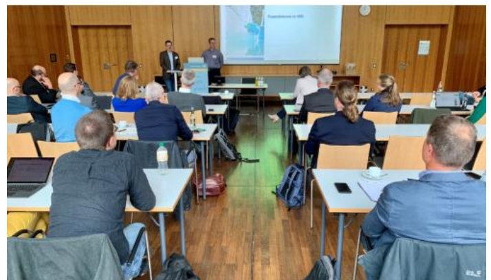
Abbildung 11: Impression vom Treffen des AK Mikroverunreinigungen.

Am 07. Mai 2025 fand am Bayerisches Landesamt für Umwelt in Augsburg das Forum Mikroverunreinigungen statt, das dem fachlichen Austausch zu aktuellen Entwicklungen und innovativen Lösungen rund um das Thema Mikroverunreinigungen diente. Im Fokus standen Vorträge zur novellierten Kommunalabwasserrichtlinie sowie zur Umsetzung der Spurenstoffentfernung in Bayern. Zudem wurden neue Technologien zur Detektion und Eliminierung von Spurenstoffen, PFAS und Mikroplastik vorgestellt, darunter Filtersysteme, Hochfrequenz-Magnetfelder und Diamantelektroden. Das Nachmittagsprogramm beleuchtete außerdem innovative Forschungsprojekte und den Transfer neuer Verfahren in die Praxis der Wasserwirtschaft. Die Veranstaltung bot zahlreiche Möglichkeiten zur Vernetzung und wurde durch engagierte Diskussionen sowie die Beiträge der Referierenden und Teilnehmenden bereichert.