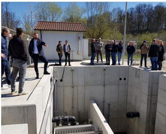
Abbildung 9: Vor-Ort-Besichtigung der Energiezentrale an der Kläranlage Günzburg.

Der Arbeitskreis Abwasserwärmenutzung tagte am 7. April 2025 in Günzburg mit rund 20 Teilnehmenden und einem vielseitigen Fachprogramm. Die Stadtwerke Günzburg präsentierten die Integration der Abwasserwärmenutzung in die kommunale Wärmeversorgung und gaben Einblicke in Planung, Genehmigung und Umsetzung der nahezu fertiggestellten Energiezentrale. Zudem wurden zukünftige Wärmekonzepte vorgestellt, bei denen Abwasserwärme einen wichtigen Beitrag zur nachhaltigen Versorgung leisten kann. Vertreter der HUBER SE erläuterten moderne Technologien zur Wärmegewinnung aus Abwasser und anderen Wasserströmen sowie erfolgreiche Praxisbeispiele aus größeren Projekten. Den Abschluss bildete eine Besichtigung der Energiezentrale an der Kläranlage Günzburg, die das große Interesse und das Potenzial regenerativer Wärmeenergienutzung eindrucksvoll verdeutlichte.