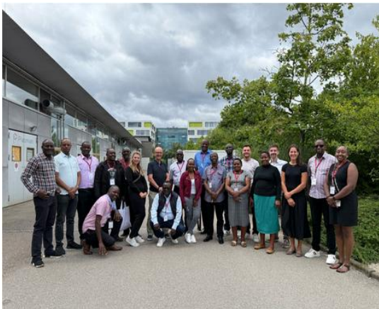
Abbildung 7: Teilnehmende des Fachinformati- onsseminar vor dem Gebäude des UTG (Foto: Alfred Mayr/UCB).

Das Fachinformati- onsseminar fand in enger Zusammenarbeit mit dem Bildungswerk der Bayerischen Wirtschaft (bbw) gGmbH - Ge- schäftsbereich International statt.