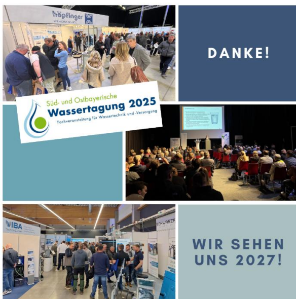
Abbildung 1: Impressionen von der 8. Süd- und Ostbayerischen Wassertagung.

Parallel zur Messe fanden ein Forum mit branchenspezifischen Vorträgen - hier wurden wegweisende neue Technologien, Projekte und Verfahren aus der Wasserwirtschaft vorgestellt - sowie das neue Technologieforum „Innovation schafft Zukunft“ statt - dort präsentierten Ausstellende der Messe ihre Innovationen, Produkte und Dienstleistungen.