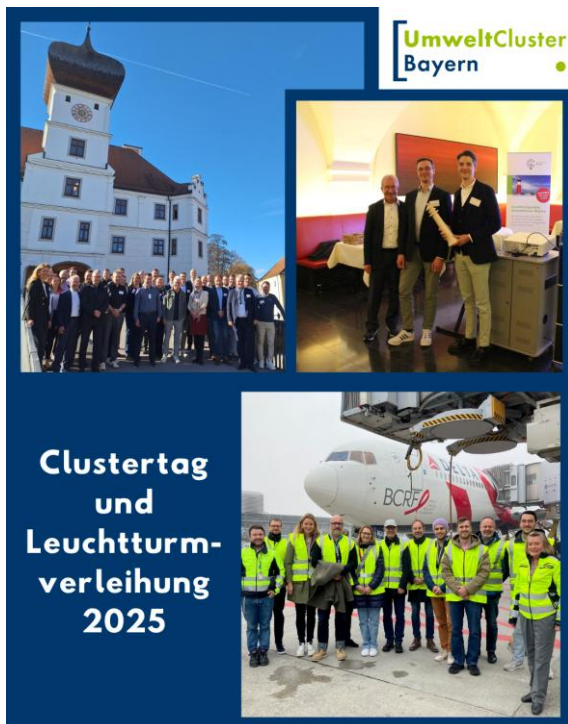
Abbildung 2: Impressionen vom Clustertag 2025 und der Leuchtturmverleihung.