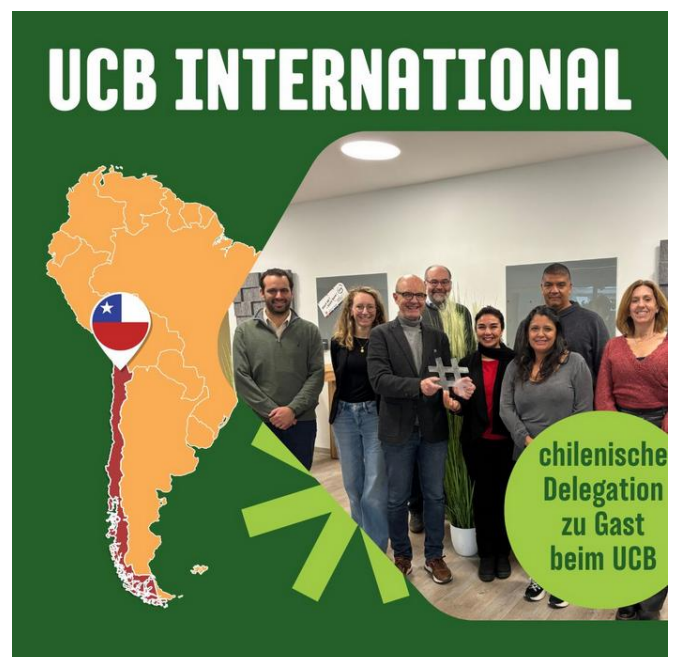
Abbildung 6: Chilenische Delegation zu Gast im UCB (Foto: UCB).

Wir freuen uns auf den weiteren Austausch und die Vernetzung!