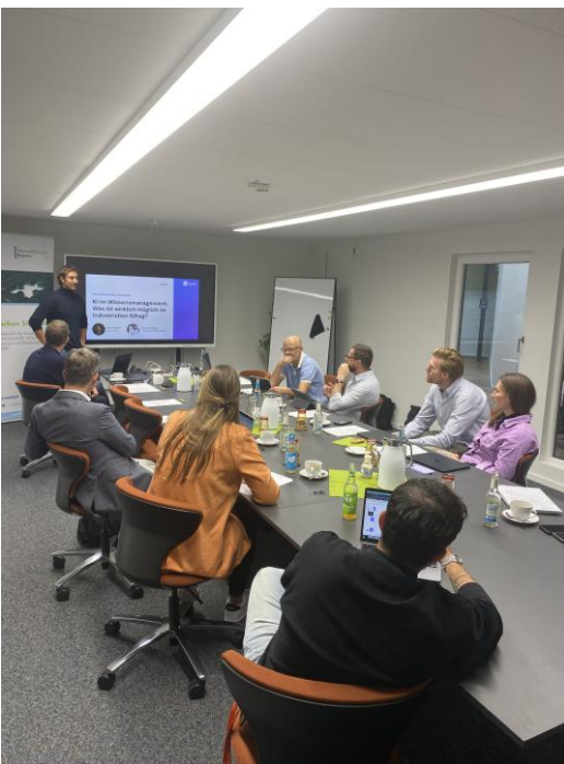
Abbildung 4: Teilnehmende beim 1. Workshop der KI-Journey.

Nach einem gemeinsamen Kick-off behandelten vier Workshops zentrale Anwendungs- und Umsetzungsfragen: KI im Wissensmanagement, Datenschutz, Datenhoheit und Datenaufbereitung, Mustererkennung und Vorhersagen sowie die Einbeziehung und Qualifizierung von Mitarbeitenden für neue Arbeitsweisen. Die Teilnehmenden erhielten fachliche Impulse von Expertinnen und Experten, diskutierten Praxisbeispiele und arbeiteten an eigenen Fragestellungen für den KI-Einsatz in ihren Unternehmen.