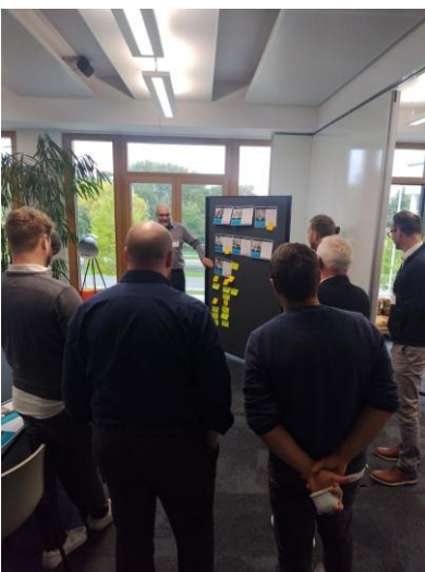
Abbildung 12: Teilnehmende beim 1. CE:Battchain Workshop

Das Projekt CE:Battchain war als Fortsetzung des CE:BAT Cross Clusters mit dem Fokus auf die Schließung regionaler Kreisläufe angelegt. Für die bereits identifizierten Schritte im Prozess-Kreislauf wurden schon aus dem Vorprojekt bekannte Stakeholder angefragt und gebeten über deren regionalen Wertschöpfungsketten Auskunft zu geben. Diese Informationen sollten dazu verwendet werden, in einem von Niedersachsen.Next im Projekt Tra-WeBa entwickelten Planspiel eingesetzt zu werden.