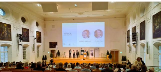
Abbildung 13: Circular Solutions in Textile & Food (Copyright: CEFoodCycle, Vallaster)

Im Projekt CEFoodCycle wird das Konzept der Circular Economy (CE) auf die Lebensmittel-Wertschöpfungskette angewandt. Das Projekt wurde im Rahmen des Interreg Alpine Space Programmes durch die Europäische Union gefördert und lief im Zeitraum vom 1.11.2022 bis 31.10.2025. Im Jahr 2025 stand die Finalisierung zentraler Projektergebnisse sowie die Sicherstellung der langfristigen Wirkung im Fokus. Im Zentrum stand die Entwicklung und Fertigstellung des digitalen Entscheidungshilfe-Tools foodcycle.ai , das Unternehmen mithilfe Künstlicher Intelligenz dabei unterstützt, ökologische Weiterverwertungsoptionen für überschüssige Lebensmittel, Nebenprodukte und Reststoffe zu identifizieren und deren CO 2 -Fußabdruck auf Basis von LCA-Daten einzuordnen. Im Mai 2025 wurde die nahezu finale Version im Rahmen eines Tool-Testing-Webinars mit Pilotanwendern und externen Stakeholdern erprobt. Die Erkenntnisse flossen direkt in die Optimierung ein. Auf dieser Grundlage konnte foodcycle.ai zum Projektende erfolgreich veröffentlicht werden. Die Plattform dient zugleich als zentraler Zugangspunkt zu den im Projekt entwickelten Materialien und bündelt neben dem Tool auch Lerninhalte, Veröffentlichungen sowie weitere praxisrelevante Ressourcen.