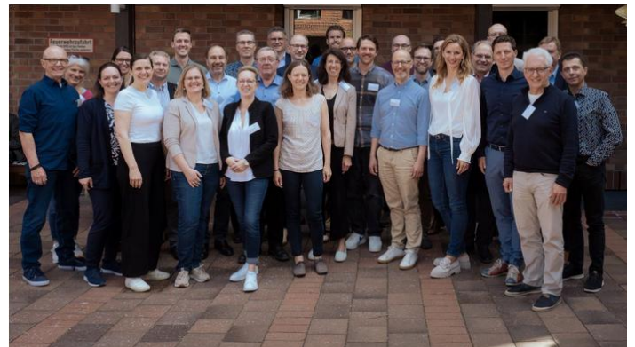
Abbildung 8: Teilnehmende der Strategiesitzung.

Dabei wurde den Fragen nachgegangen, was Gremienarbeit bedeutet und wie die Gremien zu- sammen mit der Geschäftsstelle die drängenden Themen der Umwelttechnologie-Branche Klima- resilienz, Künstliche Intelligenz oder auch Fach- kräftemangel vorantreiben können. An verschie- denen Thementischen wurden neue Ideen für Veranstaltungsformate erarbeitet